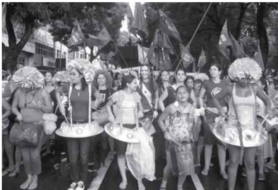
Mais de 100 militantes animaram a batucada na Marcha de abertura do FSM

O Fórum reuniu cerca de 100 mil pessoas em seis dias de debates e mobilizações, em Belém do Pará