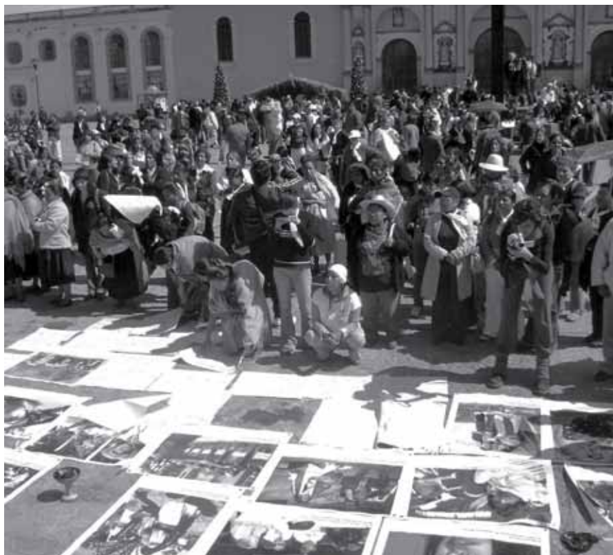
Ato de encerramento da Caravana, em Chiapas

“É uma marcha de denúncia. É uma marcha de solidariedade. É uma marcha de esperança. É uma marcha que nos convoca a continuar marchando em frente.”